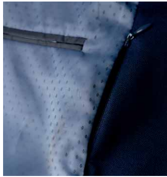
Futter der Concept Collection Sew Easy Embroidery System