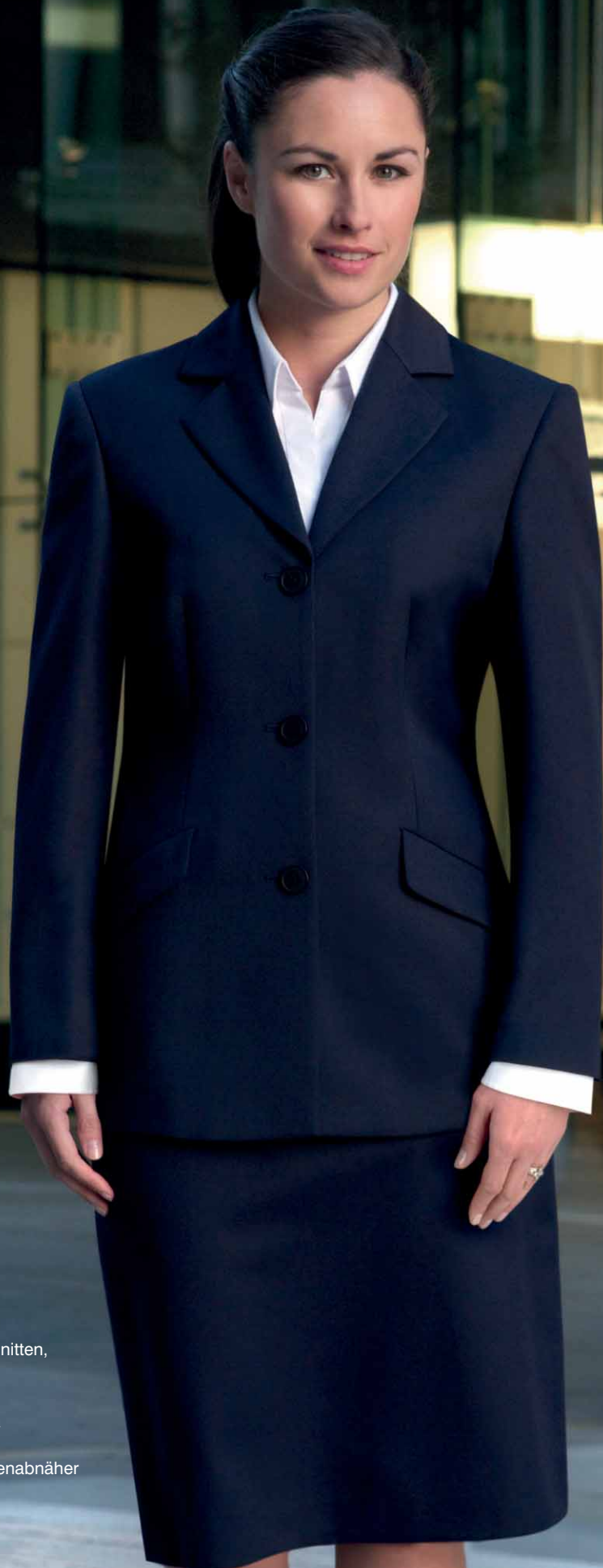
Blazer Zeta (marine)